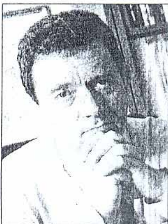
Του Δρ. ΕΥΘΥΜΗ ΛΕΚΚΑ

ΚΑΘΗΓΗΤΗ ΓΕΩΛΟΓΙΑΣ ΚΑΙ ΓΕΩΠΕΡΙΒΑΛΛΟΝΤΟΣ ΕΘΝΙΚΟΥ & ΚΑΠΟΔΙΣΤΡΙΑΚΟΥ ΠΑΝΕΠΙΣΤΗΜΙΟΥ ΑΘΗΝΩΝ