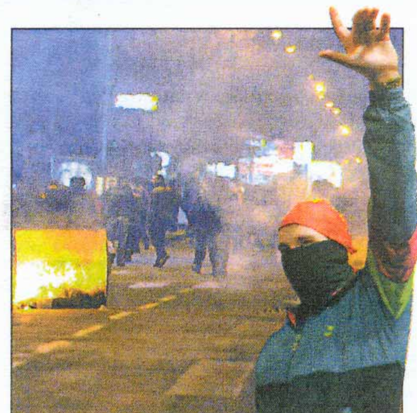
Εθνικιστές πολιορκήσαν το Γραφείο Συνδέσμου της Ελλάδας στα Σκόπια.

Απορρίπτουν και τις πέντε προτάσεις Νίμιτς για το όνομα