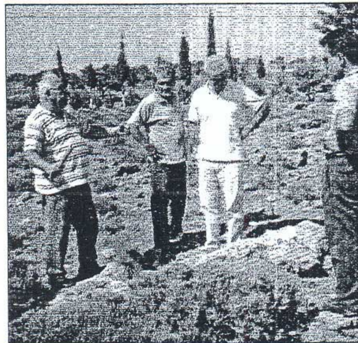
Από τη χθεσινή αυτοψία στο χώρο των ανασκαφών

θα λειτουργεί στο δήμο Αρχαγγέλου. Αυτό τόνισαν μεταξύ άλλων, ο καθηγητής Παλαιοντολογίας του Πανεπιστημίου Αθηνών Ευάγγελος Βελιτζέλος και ο καθηγητής Γεωλογίας κ. Ευθύμιος Λέκκας, στη σύσκεψη που έγινε χθες στο δήμο Αρχαγγέλου, προκειμένου να εξεταστεί η πορεία του έργου, που θα