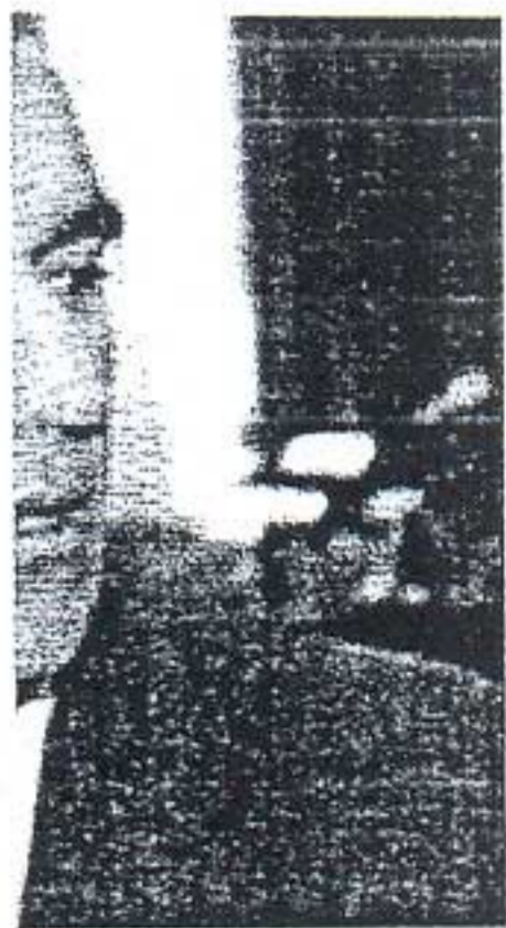
τικής Ομάδας του έπτας

χαριλαου Ιρικουπη, η Γραμματεία της Επιτροπής Εκλογικού Αγώνα του Κινήματος.