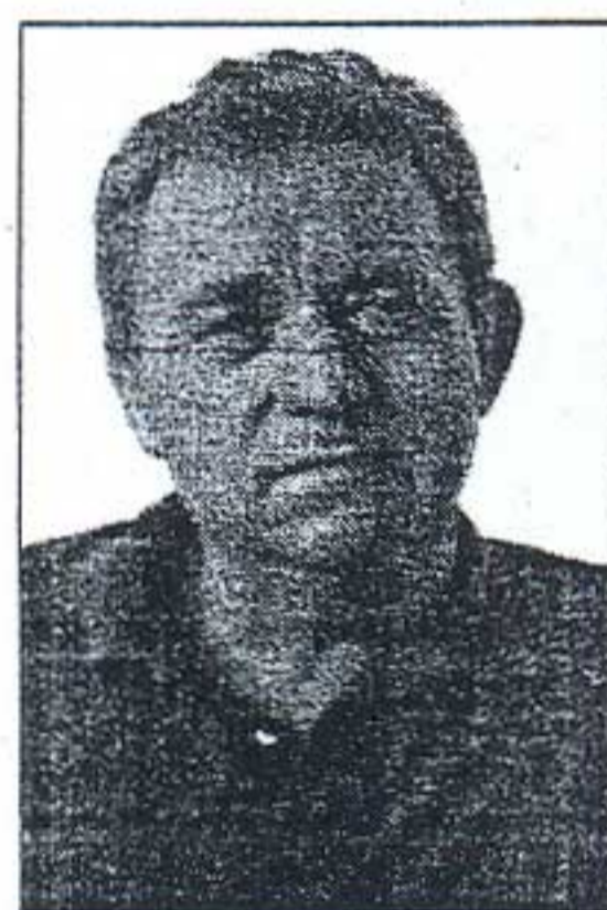
Ο Δρ. Ευθύμιος Λέκκας.

Οι τελευταίες καταστροφικές πυρκαγιές, σε όλη την Ελλάδα, δεν είναι αποτέλεσμα μόνον των ακραίων φαινομένων, αλλά κυρίως της πολιτικής των τελευταίων χρόνων, στον τομέα της αντιμετώπισης των κρίσεων, σε κυβερνητικό επίπεδο.