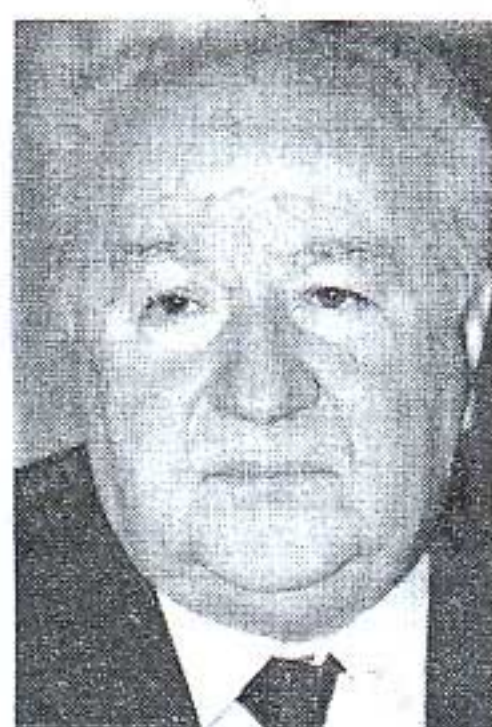
Ο κ. ΒΑΣΙΛΗΣ Παπαζάχος

Ο σεισμολόγος ερευνητής του Γεωδυναμικού Ινστιτούτου Αθηνών κ. Γεράσιμος Χουλιάρης επισημαίνει ότι η εκτόνωση της συσσωρευμένης ενέργειας είναι αναπόφευκτη, μόνο που θεωρεί ότι εγκλωβισμένη ενέργεια υπάρχει σε όλο το ελληνικό τόξο. «Οι πρόσφατοι σεισμοί στην Κεφαλλονιά και στην Απωλοακαρνανία έρχονται σε συνέχεια του ντόπιου σεισμών κατά μήκος του ελληνικού τόξου, τον τελευταίο χρόνο», δηλώνει ο κ. Χουλιάρης που δεν στέκεται μόνο στην επικινδυνότητα που παρουσιάζει η ΚΔ Ελλάδα λόγω των πρόσφατων δονήσεων αλλά τοποθετεί έναν ισχυρό σεισμό κατά μήκος όλου του ελληνικού τόξου λόγω των εξάρσεων που σημειώνονται το τελευταίο έτος. «Πέριστοι στις 8 Ιανουαρίου είχα-