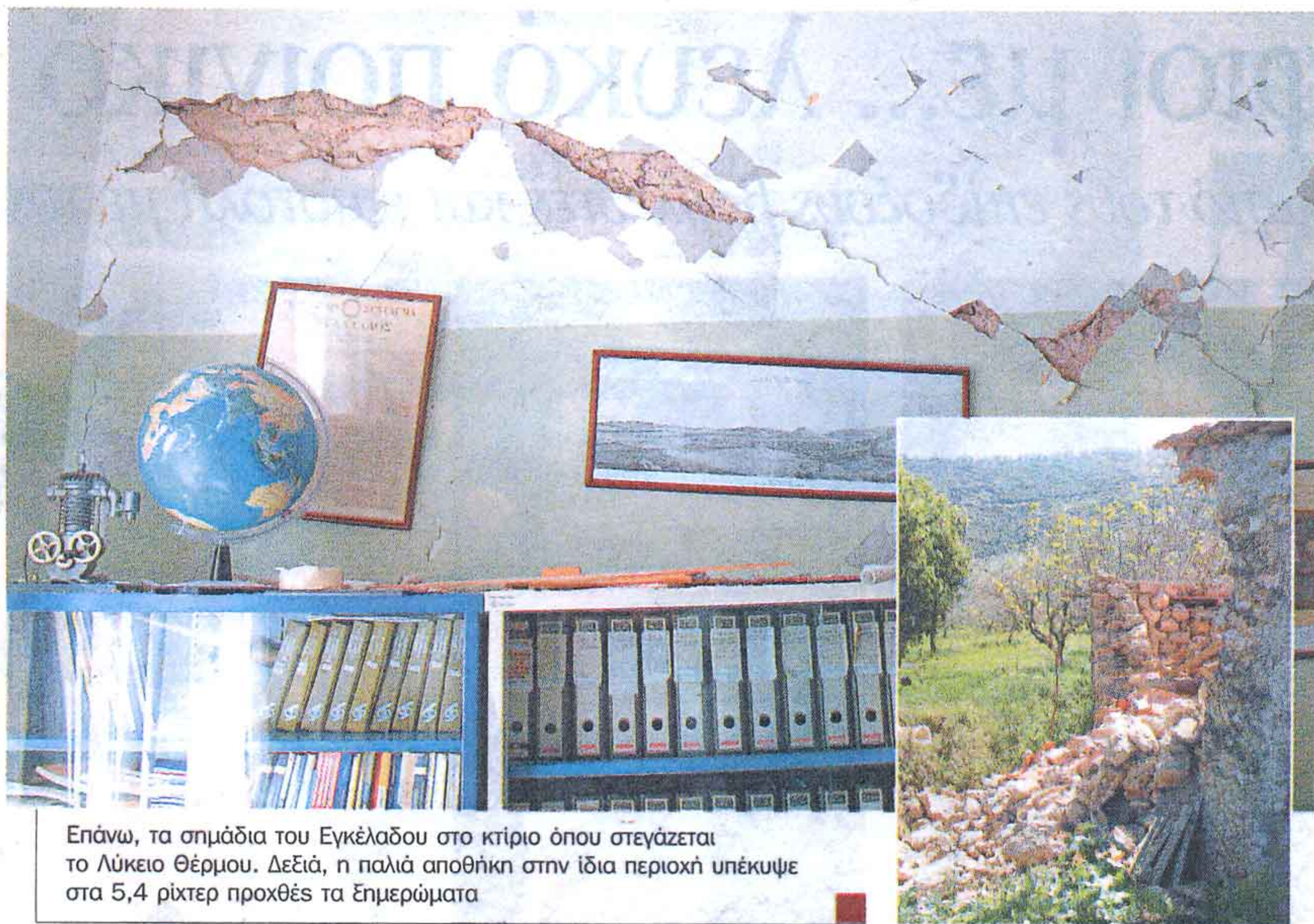
Επάνω, τα σημάδια του Εγκέλαδου στο κτίριο όπου στεγάζεται το Λύκειο Θέρμου. Δεξιά, η παλιά αποθήκη στην ίδια περιοχή υπέκυψε στα 5,4 ρίχτερ προχθές τα Επμερώματα

«Βέβαια, αυτό δεν είναι παρά μια υπόθεση και σίγουρα δεν αποτελεί κανόνα» εξηγεί ο κ. Λέκκας, ο οποίος τονίζει όμως ότι μια τέτοια εξέλιξη είναι αρκετά πιθανή. «Μπορεί η σεισμική ακολουθία να συνεχιστεί και με