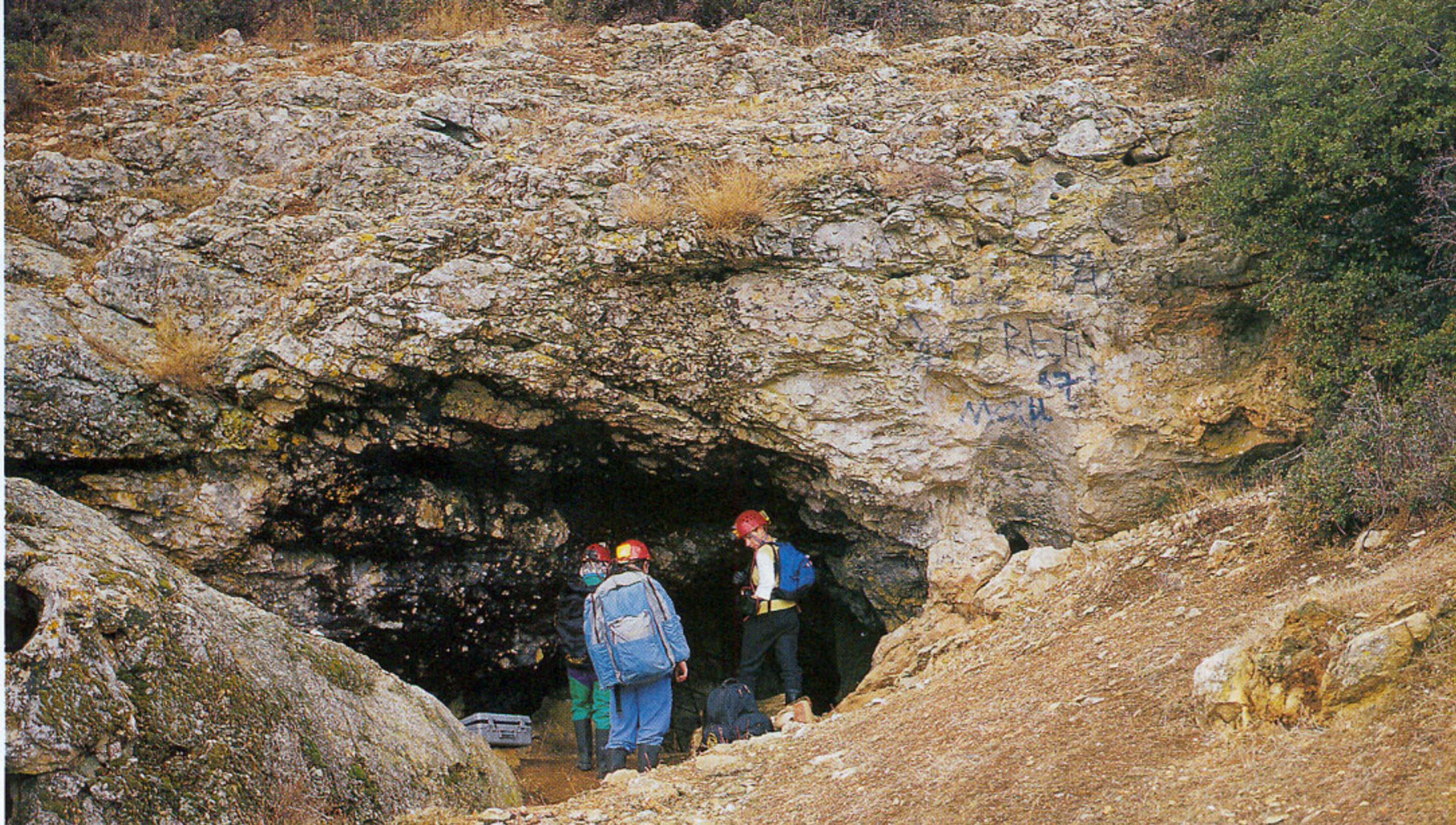
Η είσοδος του σπηλαίου του «Κύκλωπα Πολύφημου» βρίσκεται στην ανατολική πηλαγιά ενός λόφου στους πρόποδες του όρους Ισμαρος στην τοποθεσία «Κουφού Πηλαί», βορειοδυτικά της Μαρώνας

που την προφταίνετε» τάραζαν αυτόν τον κόσμο της σιωπής. Νιώθαμε σαν γίγαντες που παρατηρούν τη ζωή μιας πόλης από ψηλά. Εδώ όλοι είναι κυνηγοί και θηράματα, οι αράχνες στήνουν τα δίκτυα τους για να πιάσουν τα κολεόπτερα, οι σαρανταποδαρούσες αρπάζουν τις αράχνες, οι νυχτερίδες τρώνε τις σαρανταποδαρούσες, σκαθάρια, αράχνες, μυριάποδα τρώνε τα μικρά των νυχτερίδων όταν πέφτουν από την οροφή, σε 1 μόνο τετραγωνικό μέτρο γούανο μπορεί να υπάρχουν περισσότεροι από 33.000.000 ζωντανοί οργανισμοί. Τα τρωγλόβια είδη της Γης είναι περισσότερα από 50.000, οικοσυστήματα όπως αυτά του σπηλαίου της Μαρώνας χρειάστηκαν εκατομμύρια χρόνια για να δημιουργηθούν, κι εμείς οι σύγχρονοι άνθρωποι απειλούμε να τα καταστρέψουμε με επεμβάσεις για την τουριστική εκμετάλλευση των σπηλαίων. Αλλά και εμείς οι μελετητές έχουμε μερίδιο ευθύνης: σε κάθε βήμα μου στο σπηλαιικό σκεπτόμουν ότι ίσως δεκάδες οργανισμοί συνθλίβονται κάτω από την μπότα μου και ακόμη και τα φλας ενοχλούν αφάνταστα τα χιλιάδες πλάσματα που έμαθαν να ζουν στο σκοτάδι. Καταλήγοντας, φαίνεται ότι εμείς οι σύγχρονοι πολιτισμένοι άνθρωποι αποτελούμε μεγαλύτερη απειλή για την πανίδα του σπηλαίου της Μαρώνας από το μυθικό Κύκλωπα Πολύφημο, που έζησε σ' αυτό χωρίς να την καταστρέψει. ■