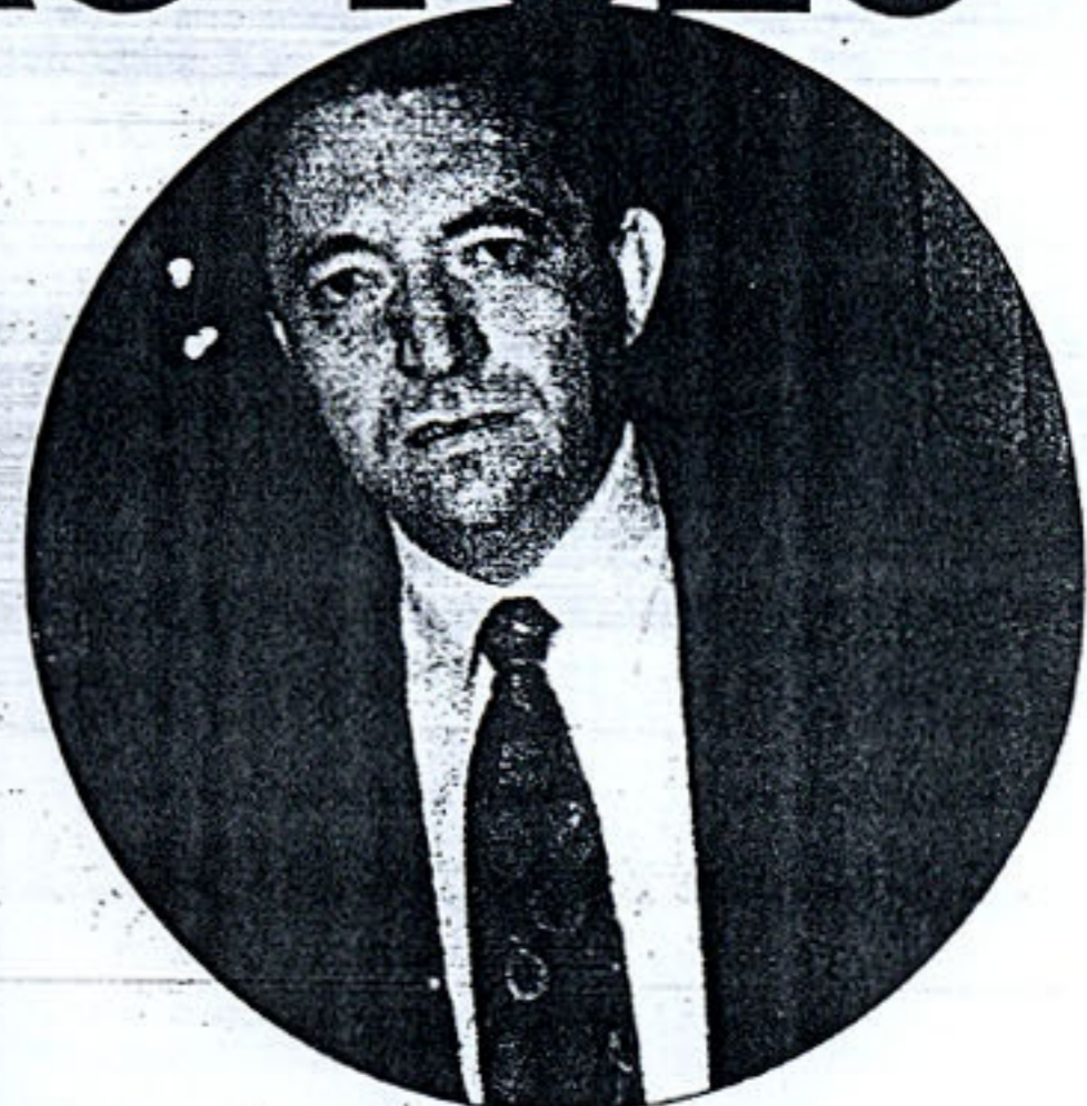
Σε κατάσταση επιφυλακής βρίσκονται οι επιστήμονες μετά τις αλληπάλληλες σεισμικές δονήσεις του τελευταίου διαστήματος στο Ιόνιο πέλαγος. Πάνω ο Ευθύμιος Λέκκας.

«Espresso» ο καθηγητής Γεωλογίας του Πανεπιστημίου Αθηνών Ευθύμιος Λέκκας και προσθέτει: «Οι σεισμοί που έχουν γίνει αυτόν τον καιρό στο Ιόνιο φανερώνουν ότι υπάρχουν εστίες, οι οποίες βρίσκονται σε σεισμική διέγερση. Το Ιόνιο όμως δεν είναι η μόνη περιοχή της χώρας μας, η οποία παρουσιάζει σεισμική δραστηριότητα. Και στον Πατραϊκό κόλπο συχνά σημειώνονται σεισμικές δονήσεις, οι οποίες προς το παρόν δεν έχουν μεγάλα μεγέθη. Πρέπει να παρακολουθήσουμε τα φαινόμενα με ιδιαίτερο ενδιαφέρον».