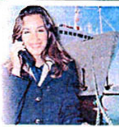
■ ΣΕΛ. 13

Πιο ακριβά εισιτήρια πλοίων, τηλεφωνήματα