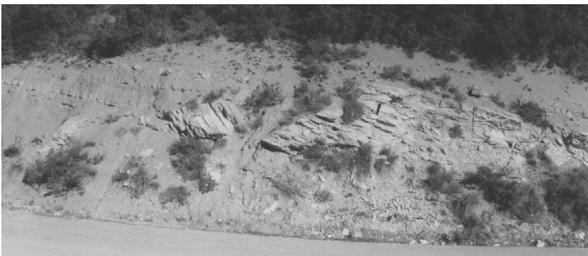
Εικ.3 Παλαιο-ολισθήσεις ασβεστιτικών μαργών υπό τη μορφή σφηνών και ολισθολίθων ανάμεσα στους αδιατάρακτους ψαμμιτικούς ορίζοντες του φλύσχη.