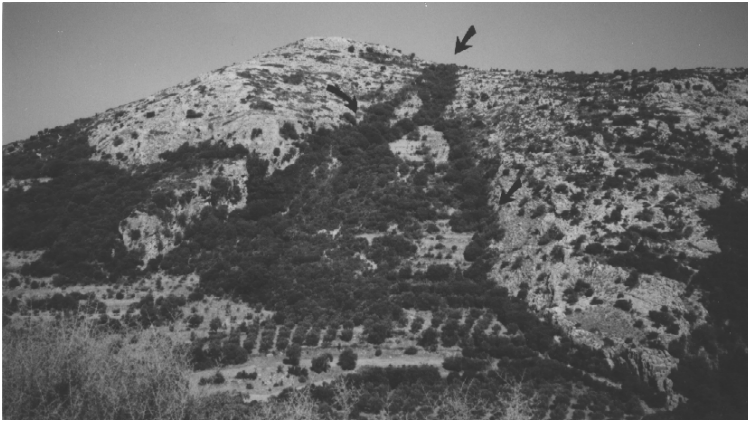
Εικ.2 Αποψη των συνιζηματογενών γωνιωδών ρηγματίων στην επαφή ασβεστόλιθων/φλύσχη.